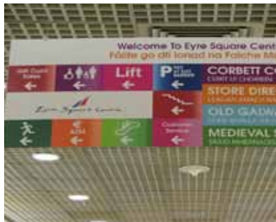
An chomharthaíocht nua a chuir Ionad na Faiche Móire, An Fhaiche Mhór in airde i 2010.