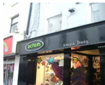
An chomharthaíocht nua lasmuigh a chuir Schuh in airde ar Shráid na Siopaí in 2010.