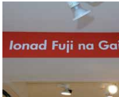
An chomharthaíocht nua a chuir Ionad Fuji na Gaillimhe, Sráid na Siopai in airde in 2010.