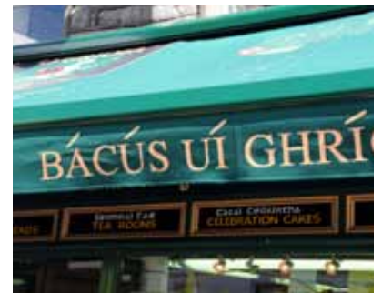
An chomharthaíocht nua a chuir BÁCÚS Uí Ghríofa/Griffin's Bakery, Sráid na Siopai in airde in 2010.