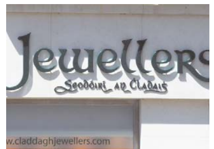
Seodóirí an Chladaigh, Sráid an Phríomhgharda, Gaillimh