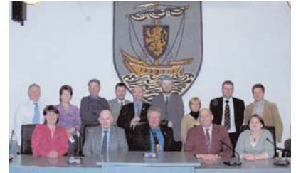
Comhairleoirí Cathrach na Gaillimhe agus baill de Choiste Logainmneacha, Comhairle Cathrach na Gaillimhe in éineacht le Comhairleoirí agus Oifigigh Ó Cheantar Fhear Manach nuair a thug siad cuairt ar Ghaillimh i rith 2006.