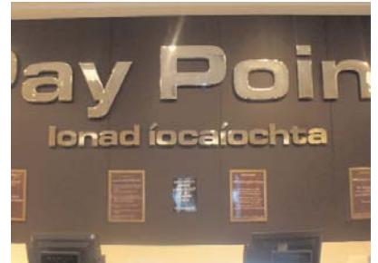
Dunnes Stores, Edward Square, Gaillimh