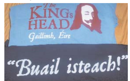
The Kings Head, Sráid Ard, Gaillimh