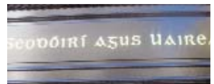
A Hartmann & Son Ltd., Sráid Liam, Gaillimh.